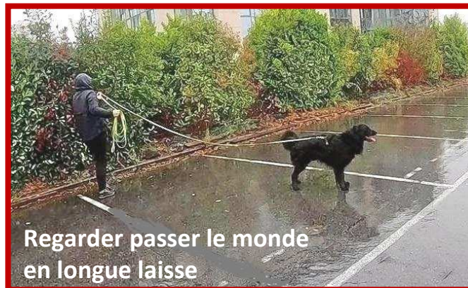
Regarder passer le monde en longue laisse

Respecter ses limites permettra à notre chien de prendre confiance et de reculer ses limites par lui-même.