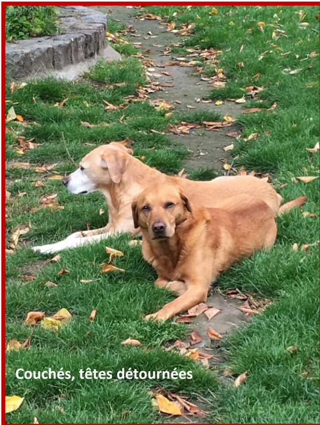
Couchés, têtes détournées

Aussi souvent que possible, donnons-leur la possibilité de faire des choix ou faisons le bon choix pour eux jusqu'à ce qu'ils en soient capables eux-mêmes.