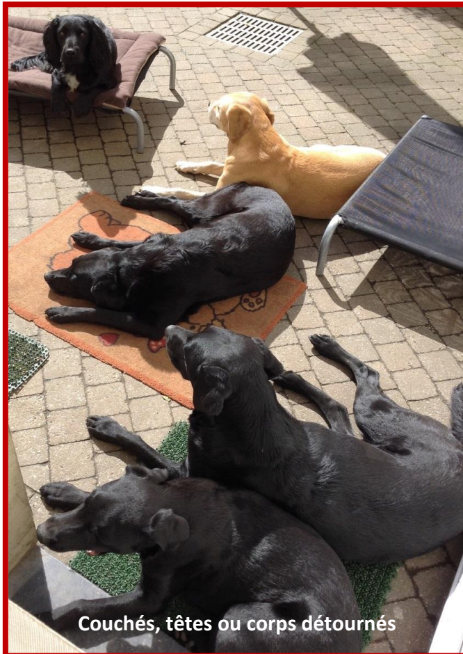
Couchés, têtes ou corps détournés

Les chiens ont besoin de compagnie et apprécient les contacts sociaux. Le terme « signal d'apaisement » a été créé par Turid Rugaas, moniteur canin, comportementaliste et auteur de renommée internationale, pour décrire le langage corporel que les chiens utilisent pour éviter les conflits, pour réduire le stress et pour communiquer un maximum d'informations tout autour d'eux.