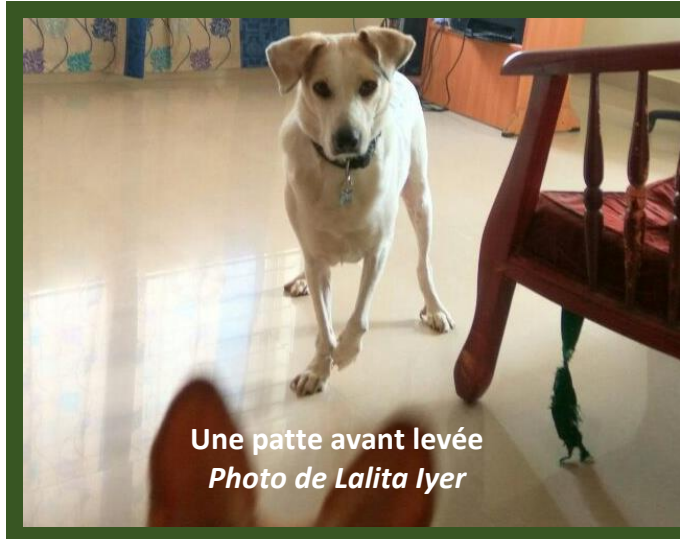
Une patte avant levée

Si cela vous intéresse ou si vous désirez obtenir plus d'informations, n'hésitez pas à nous contacter